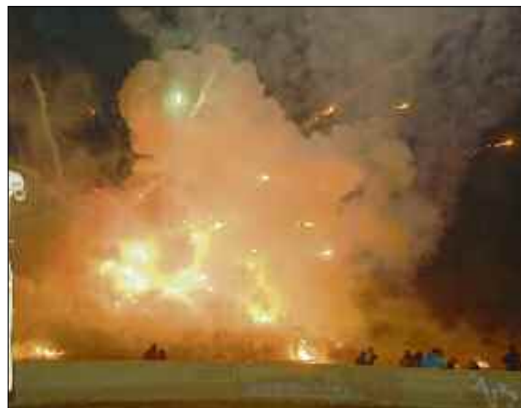
■ La hoguera de San Antón de San Agustín es espectacular.

vez allí, en torno a las 19:30 horas, tendrá lugar el encendido de la hoguera gigante y el tradicional castillo de fuegos artificiales. Los presentes disfrutará también de las actuaciones de una charanga y el espectáculo de danza con fuego de ‘Ishum’. Habrá barra, reparto de anís y mantecados, así como una rifa.