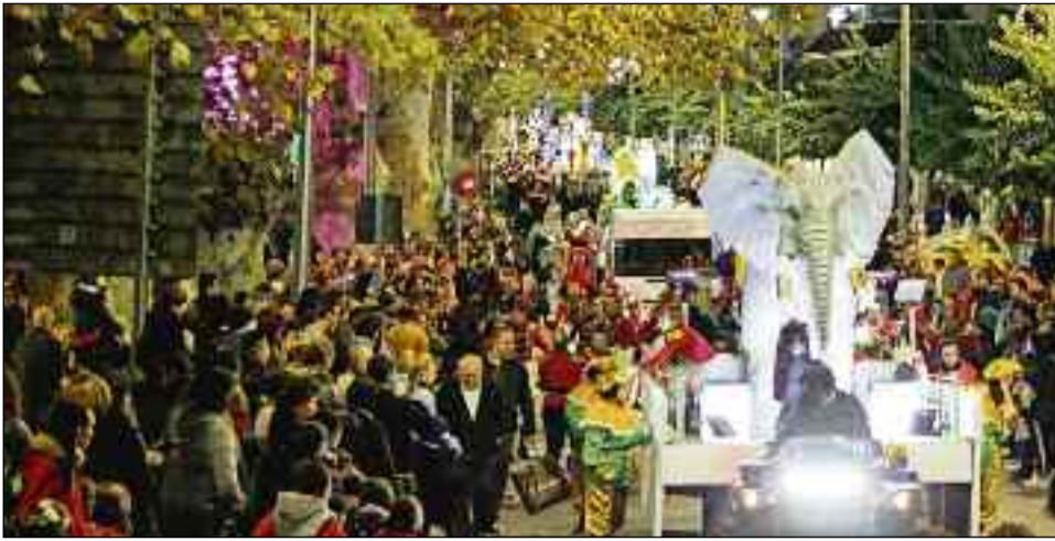
■ Calles repletas para ver la cabalgata de los Reyes Magos en Berja.