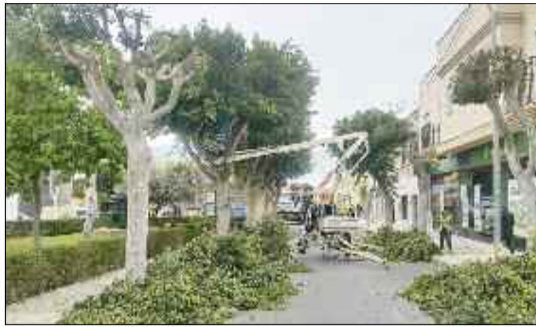
■ Obras realizadas durante 2018 en Vícar.

De las 9.878 actuaciones llevadas a cabo, un total de 2.468 corresponden a Electricidad, por las 2.194 de Fontanería, las