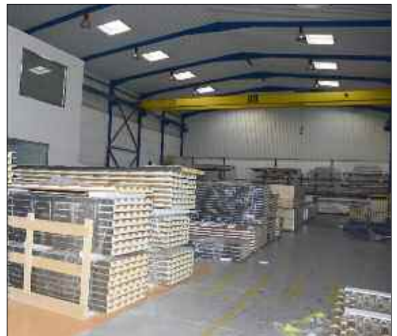
■ Almacén de paneles de Herrajes del Poniente.

La empresa, que ofrece café gratis a sus clientes hasta las diez de la mañana, pone a disposición de sus clientes su amplio catálogo de productos también a través de Internet, en concreto a través de la página www.herrajesdelponiente.com .