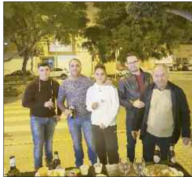
■ Asistentes a la inauguración tras la remodelación.