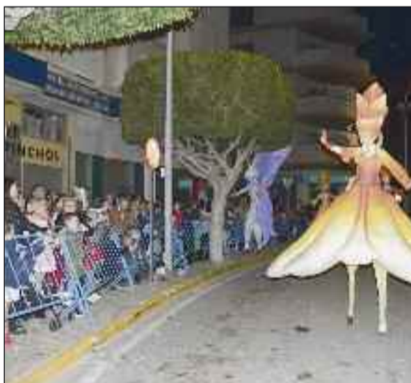
■ Participaron pasacalles internacionales.