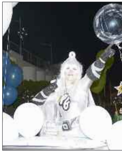
■ Superhéroes para cerrar el desfile.