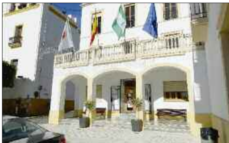
■ Fachada del Ayuntamiento de Dalías.

Los votos de PSOE e IU sacaron adelante, el pasado 28 de diciembre, el presupuesto municipal de Dalías cifrado en 3.700.000 euros. El alcalde daliense, Francisco Giménez, defendió las cuentas en declaraciones a D-CERCA y recordó que se trata de un presupuesto "lastrado por la deuda de las tres legislaturas anteriores de la derecha, lo que nos obliga a destinar más de medio millón a quitar esa deuda". Las cuentas, según destacó, también incluyen una subida del sueldo a los funcionarios, "tras el desbloqueo de la medida de Rajoy del año 2011".