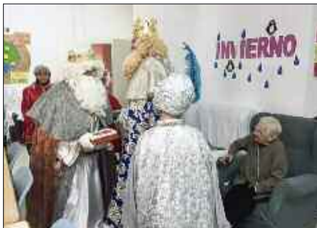
■ La residencia de mayores de Dalías recibió a los Reyes.