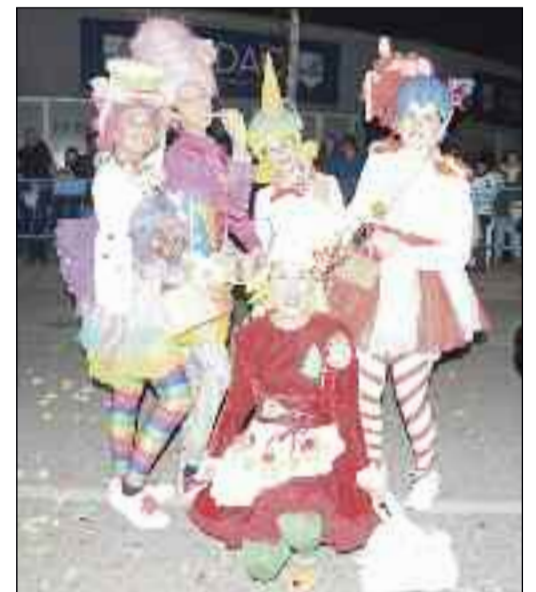
■ Divertido pasacalles de 'Chuches'.