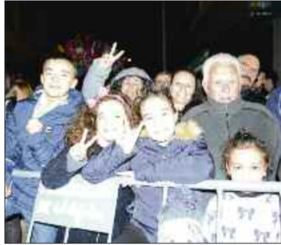
■ En la espera, junto al Auditorio ejidense.