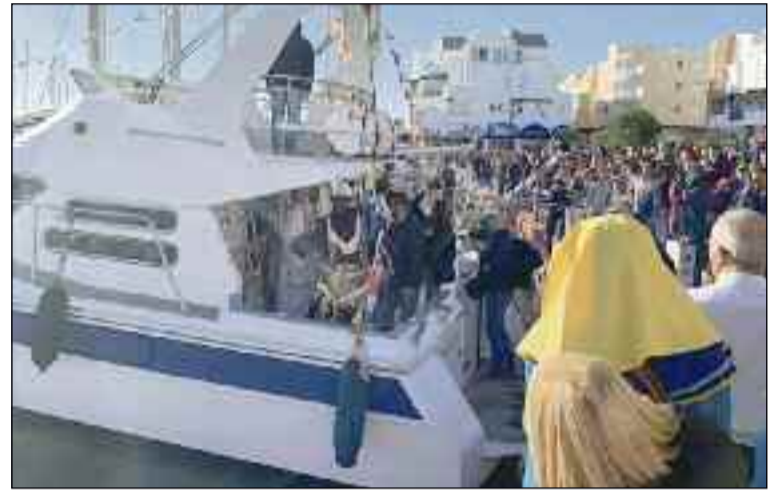
■ Sus Majestades retomaron este año su llegada por barco.