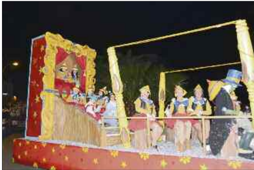
■ Hubo siete cabalgatas infantiles; esta dedicada a Pinocho.