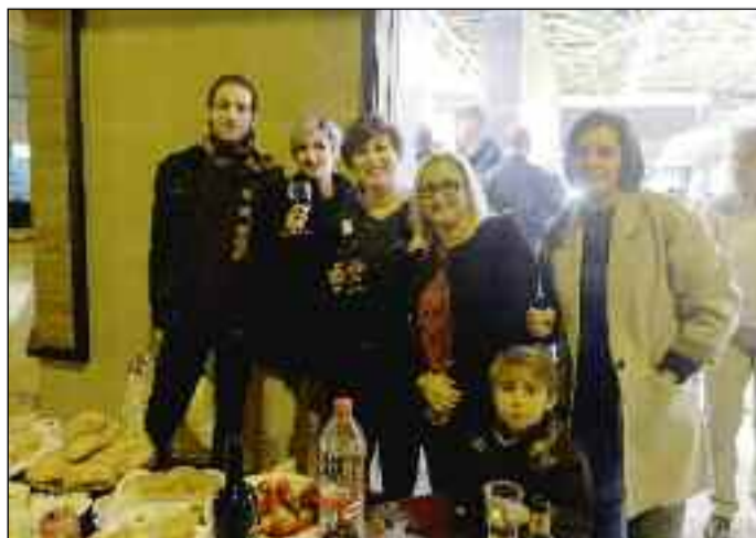
■ Reunidos con motivo de la reinauguración.