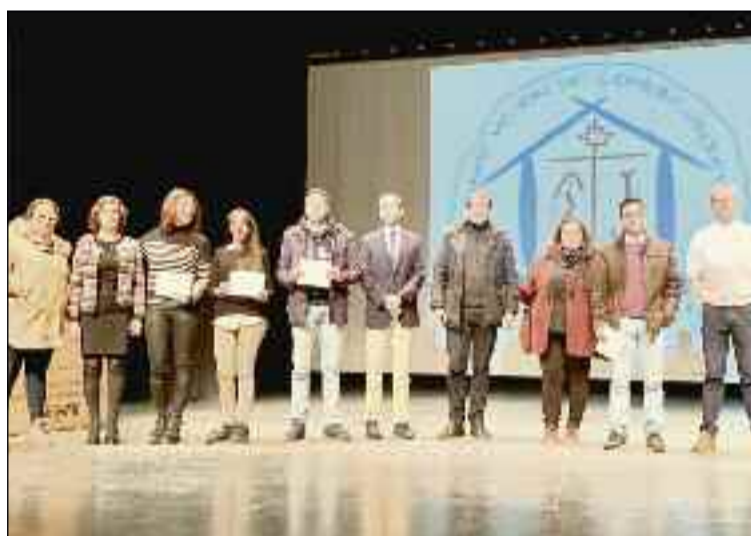
■ El acto se celebró en el Centro Cultural de Adra.

♦ La Asociación de Comerciantes y Centro Comercial Abierto de Adra ha repartido 3.000 euros en premios en su Sorteo Estrella. El Centro Cultural acogió este sorteo en el que se premió con un cruceiro por el Mediterráneo valorado en 1.500 euros y tres vales de compra de 500 euros.