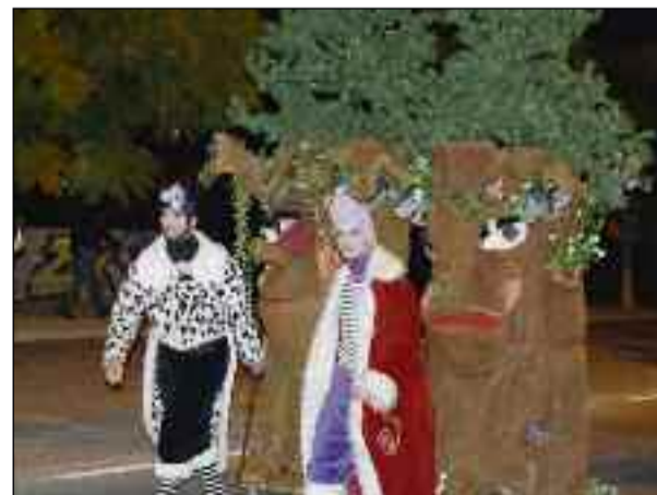
■ Bosque encantado en Vícar.