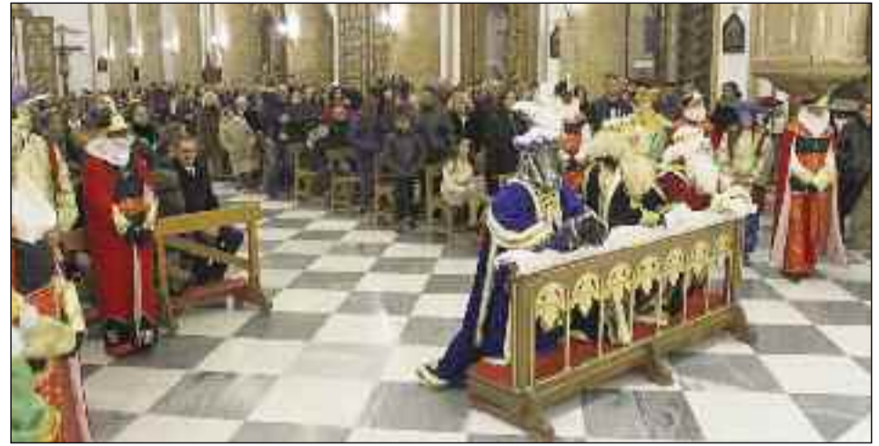
■ Tradicional parada en la Iglesia de la Anunciación, en Berja.