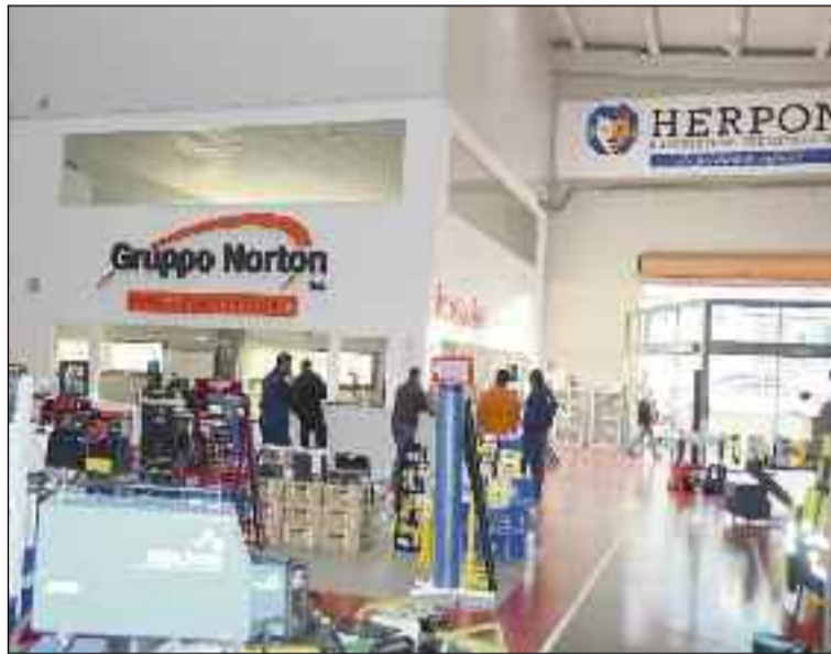
■ Los clientes no faltan desde primera hora de la mañana.