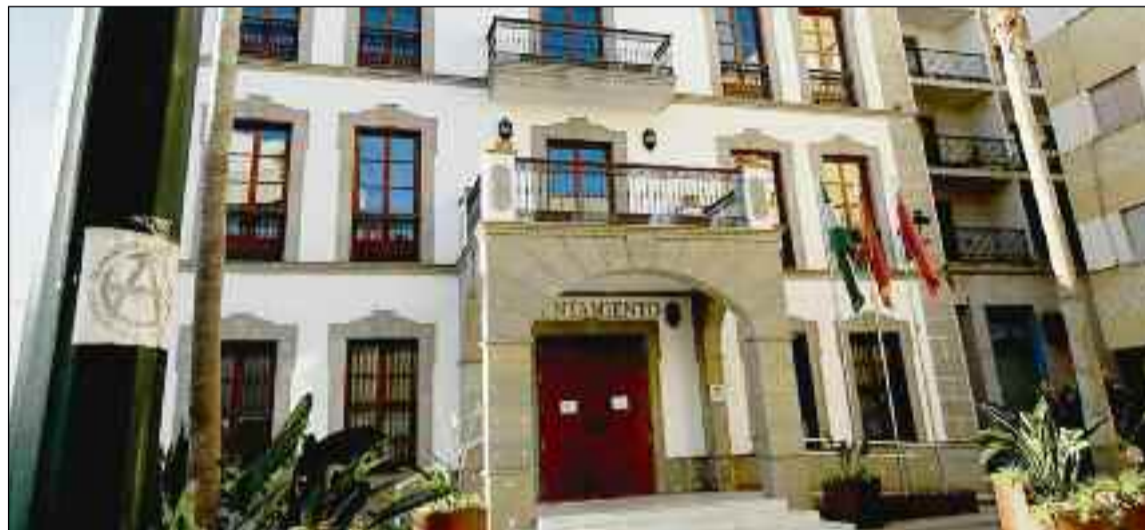
■ Fachada del Ayuntamiento de Adra.

El alcalde de la ciudad abderitana destaca, además, la reducción de la deuda municipal en 10 millones de euros