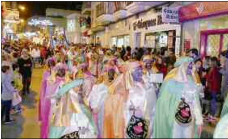
■ Parte del séquito que recorrió las calles abderitanas. /DC