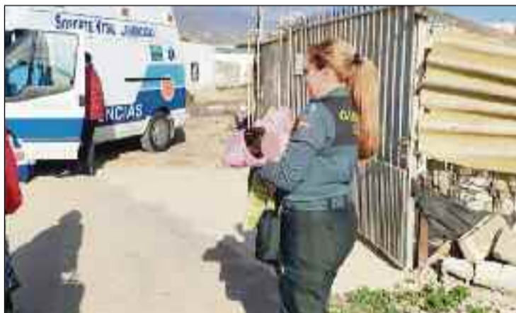
■ Una de las agentes en el auxilio de los menores ejidenses.

En la actualidad, la madre, a la que se le diagnosticó una enfermedad psicológica, convive con un hermano llegado desde Palma de Mallorca.