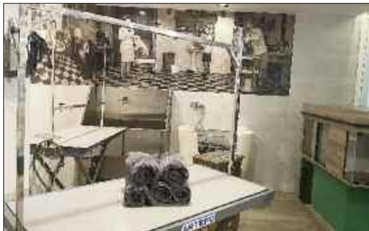
■ Las nuevas instalaciones tienen bañera de hidromasaje.

‘Mascotas Chow Chow’ cuenta con un completo catálogo de mascotas: perros, gatos, roedores, pájaros y una amplia variedad de piscinas de peces de agua dulce (fría y caliente). En cualquier caso, los clientes tienen la posibilidad de encargar el animal que deseen. El centro cuenta también con profesionales plenamente cualificados y dispuestos al asesoramiento durante la compra.