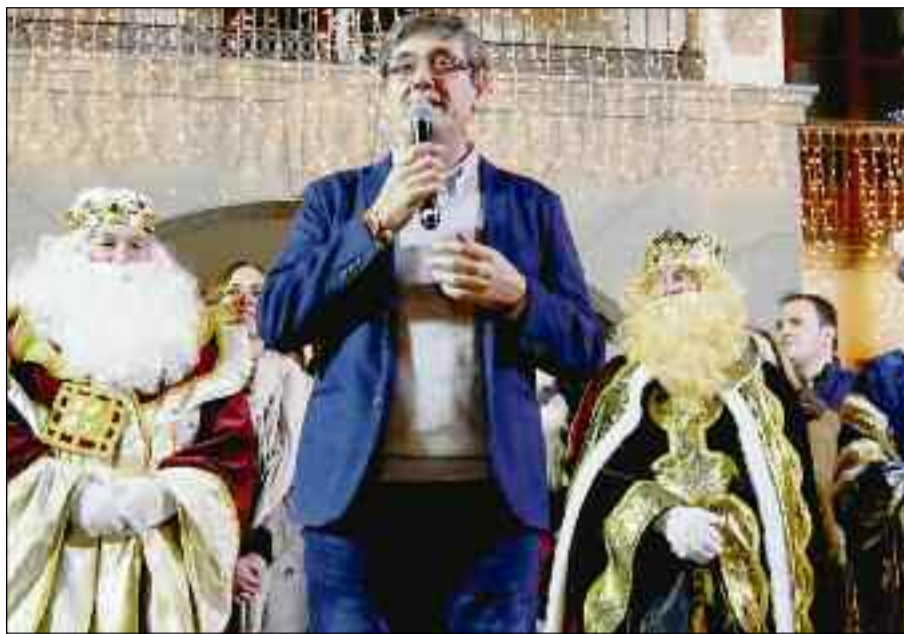
■ El alcalde de Adra, en su recibimiento a los Reyes Magos.

En el municipio de La Mojonera, los Reyes Magos llevaron la magia y diversión a los niños del municipio gracias a una cabalgata que recorrió las principales vías.