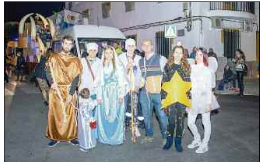
■ Participantes en la cabalgata de La Mojonera.