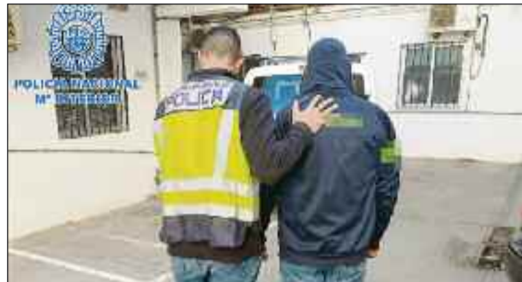
■ La detención fue efectuada por la Policía Nacional en El Ejido.

Al arrestado se le considera autor de dos robos mediante el