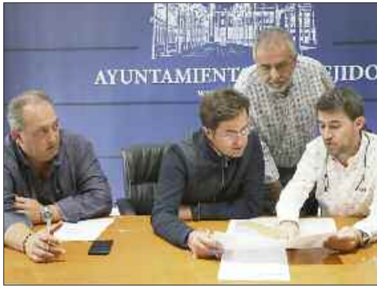
■ Alcalde y concejales analizando el proyecto aprobado.

En concreto, las obras consistirán en la ejecución del acerado y se protegerá el talud de la carretera AL-400 mediante una línea de bordillo, que también actuará como correaguas. Además, está prevista la inclusión de un rasanteo previo de toda la superficie a pavimentar, de manera que se perfilará con una capa de zahorra artificial y una