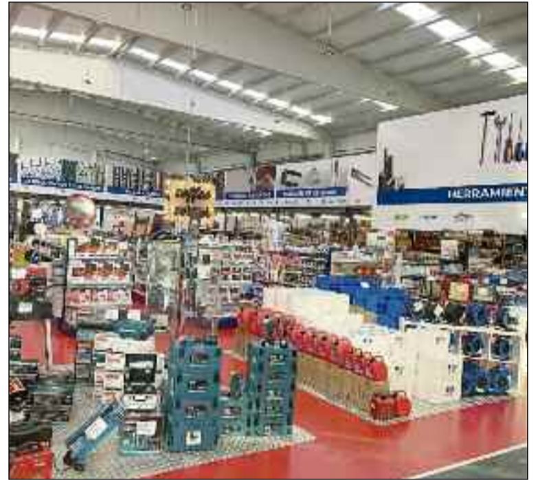
■ Vista general de la parte de venta al público de HERPON.