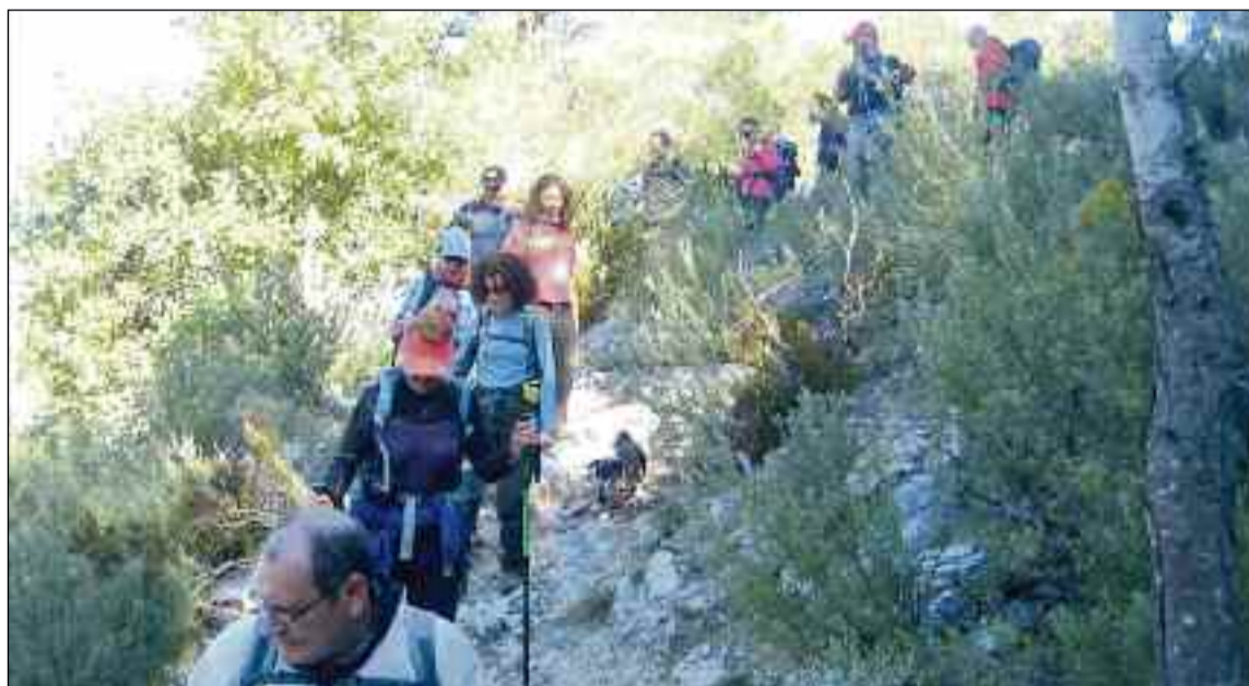
■ Alrededor de 300 participantes han disfrutado hasta el momento de este programa.

Esta primera salida cuenta con una dificultad media. El recorrido comprende trece kilómetros a recorrer que incluye visitas a las localidades de Guájar Fondón, Guájar Faragüit y Guájar Alto, además de conocer el llamado 'Machu Pichu' granadino, un asentamiento almohade del siglo XIII. Un gran escenario, como los cinco visitados