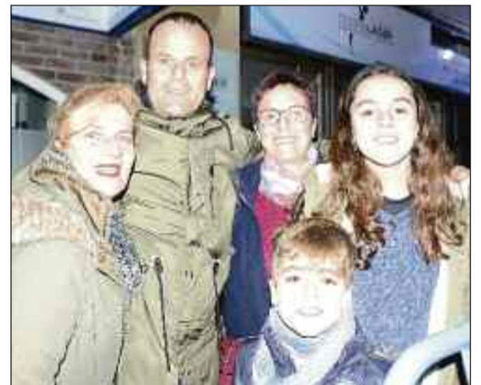
■ La familia al completo cumpliendo con la tradición.