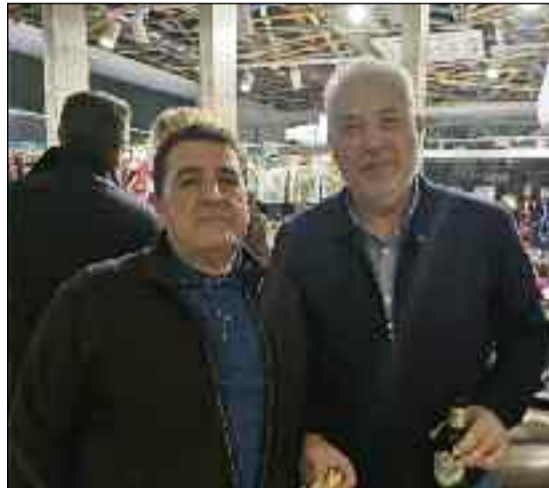
■ Posando en el acto para D-CERCA.