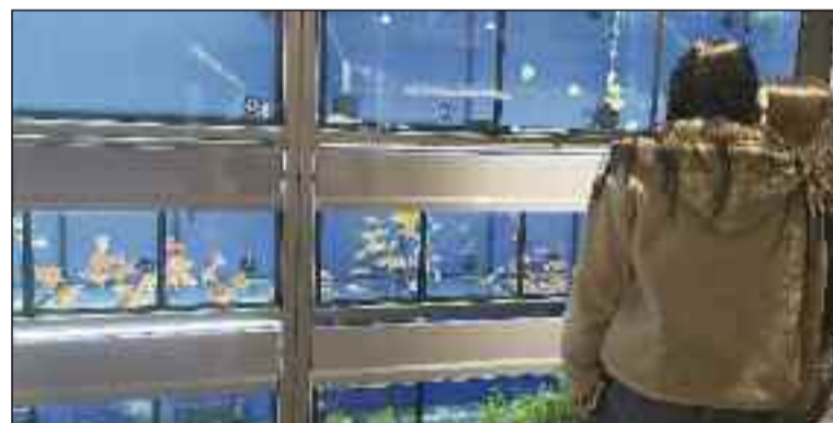
■ Hay piscinas de peces de agua dulce, fría y caliente.