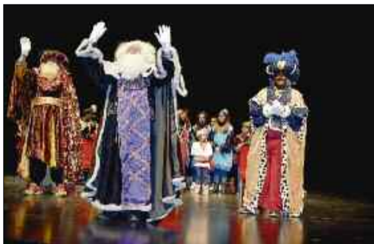
■ En el Teatro Auditorio Ciudad de Vícar entregaron regalos a algunos de los menores asistentes.