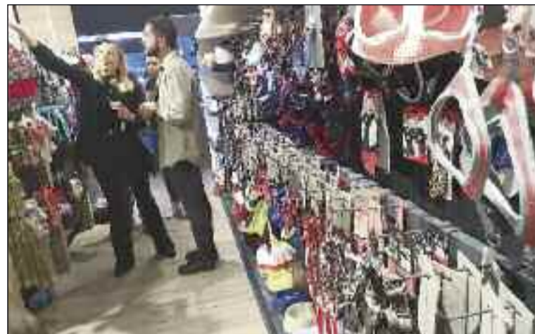
■ ‘Mascotas Chow Chow’ cuenta con muchos accesorios. / C. PAK