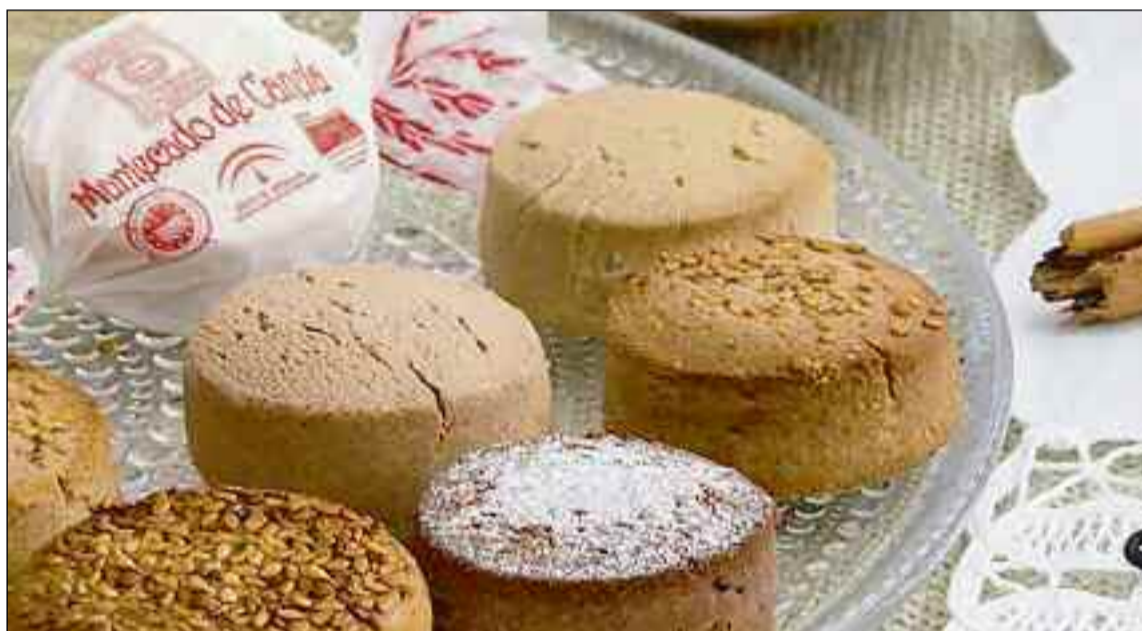
■ Después de la época navideña se debe retomar una dieta equilibrada y hacer ejercicio físico.

Después de estas fiestas navideñas, Bränemark, clínica de diagnóstico y tratamiento odontológico integral, aporta algunos consejos para volver a tener un óptimo estado de salud y retomar un estilo de vida saludable. Por un lado, se recomienda dejar de consumir alimentos hipercalóricos ya que, a pesar de haber finalizado las fiestas, en la mayoría de los hogares siguen habiendo productos ricos en azúcares y grasas.