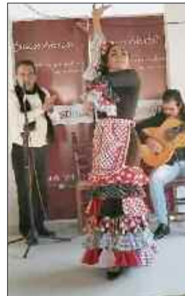
■ Una de las actuaciones.