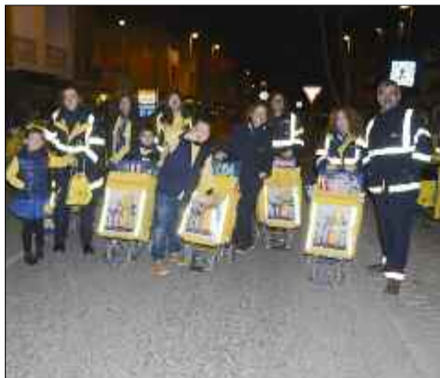
■ El equipo de Carteros Reales recogió cartas de última hora.