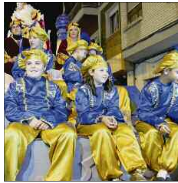
■ Los niños fueron los protagonistas en Adra.