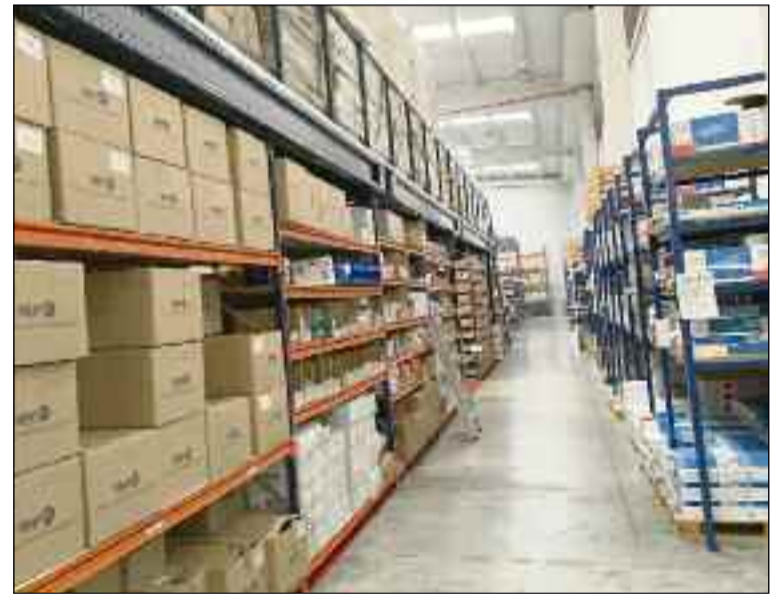
■ Cuentan con existencias siempre para envíos y reposición. /R. V. A.

rando una mayor gama de productos. Además, se ha mejorado la presentación de los mismos con una mayor diferenciación de modelos y marcas para que los clientes escojan según sus necesidades. HERPON cuenta siempre con material en stock.