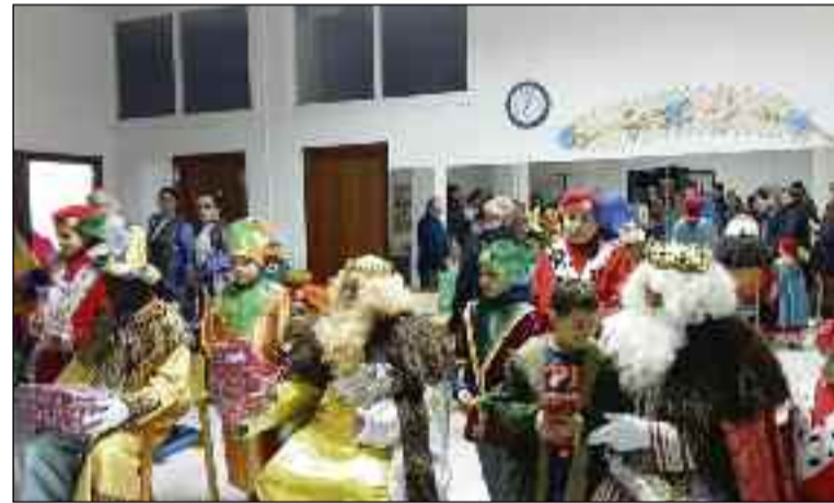
■ Entregando regalos en el término municipal de Vícar.