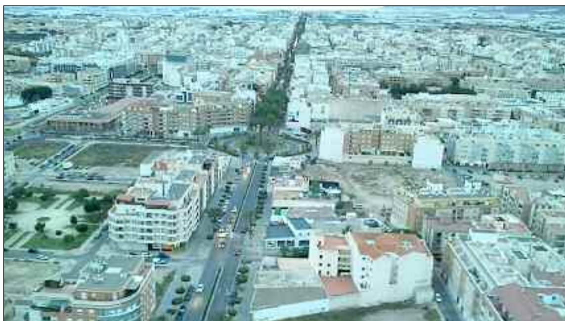
■ Imagen aérea de la zona del Bulevar de El Ejido.

Desde el Ayuntamiento ejidense aseguran que se trata de un descenso de, en su mayoría, población inmigrante extracomunitaria, “fruto del incremento de los controles del Padrón Municipal para evitar fraudes”