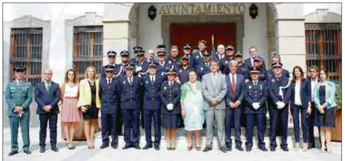
■ Agentes de Policía Local de Adra con el alcalde de la ciudad.

Cabe recordar que el cuerpo de la Policía Local de Adra lo integran en la actualidad cerca de 40 agentes. Cortés resaltó que “hemos elevado ya consultas al Gobierno de España para