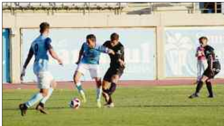
■ Antes del descanso, los ejidenses tuvieron dos ocasiones de gol. /DC

Fue un encuentro de pocas ocasiones, un tiempo para cada equipo y donde el orden táctico de los dos conjuntos posibilitó este reparto de puntos porque tanto celestes como malagueños hicieron méritos para no perder, aunque cualquiera de los contendientes pudo lograr el triunfo. Los ejidenses se prodigaron poco en ataque en el primer tiempo, aunque antes del descanso Carralero tuvo