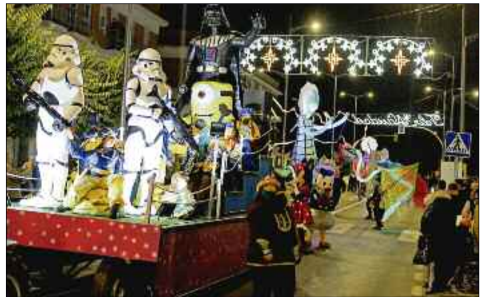
■ Películas míticas como Star Wars se colaron en el desfile virgitano.