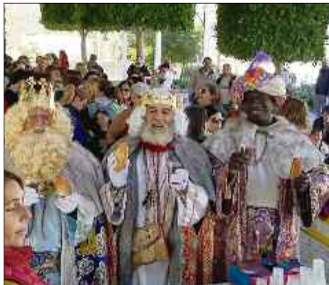
■ Tomando un chocolate caliente en Celín. /DC