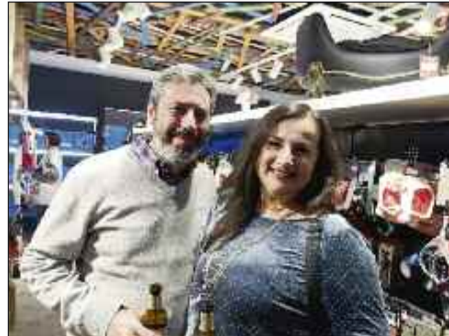
■ Amigos y clientes no faltaron a la cita.