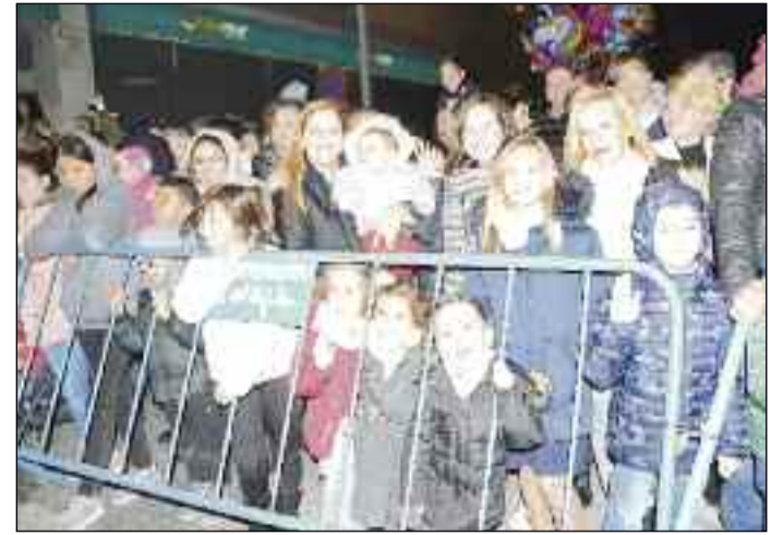
■ La ilusión de los pequeños se reflejaba en sus rostros. /A. F. V.