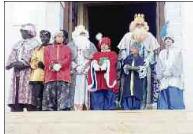
■ Sus Majestades y pajes, posando en Dalías.