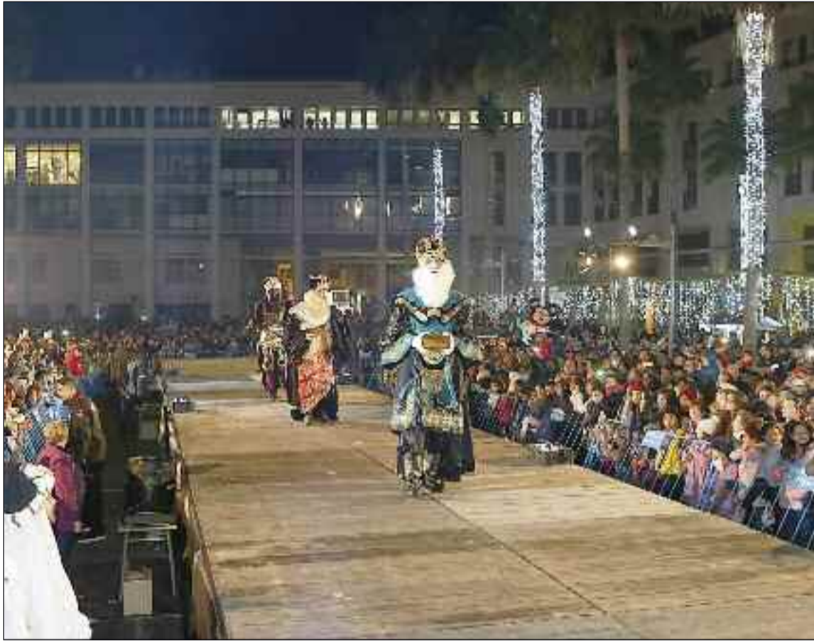
■ Recibimiento de Melchor, Gaspar y Baltasar en la Plaza Mayor de El Ejido.