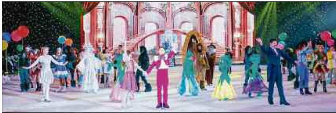
■ Un momento del espectáculo 'Bella y Bestia' del Palacio del Ballet del Palacio de Hielo de Moscú.

La cita es el próximo domingo, día 13 de enero, a las cinco y media de la tarde, en el Centro Cultural de la ciudad, las entradas están ya a la venta