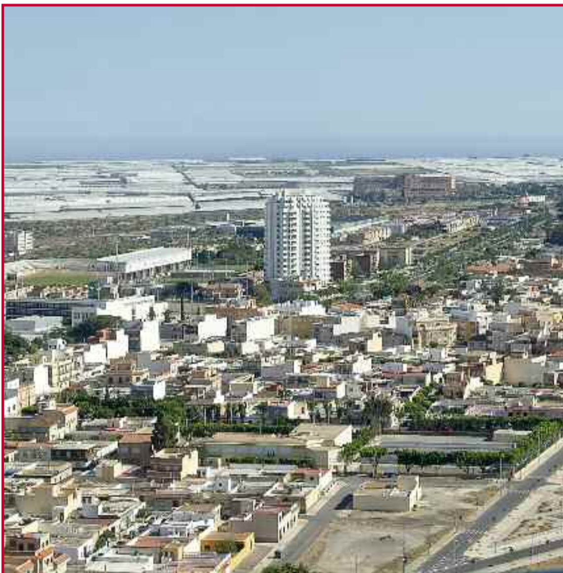
■ Vista aérea del barrio ejidense de Santo Domingo. / Elena Sánchez

La oposición culpa al Gobierno ejidense de este descenso poblacional mientras que en el Ayuntamiento dicen que se debe a los controles en el padrón municipal para evitar fraudes