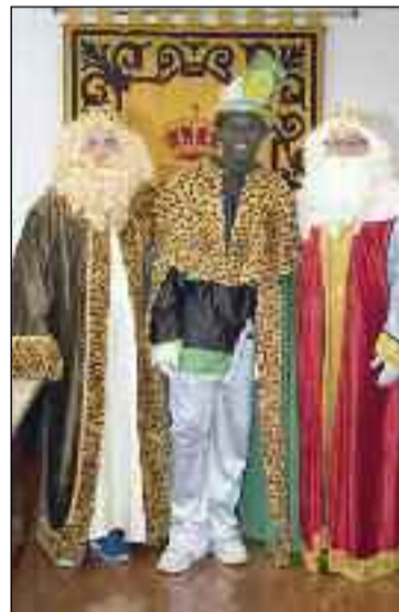
■ Los Reyes en La Mojonera.