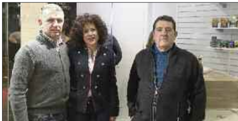
■ Quedaron encantados con las nuevas instalaciones.